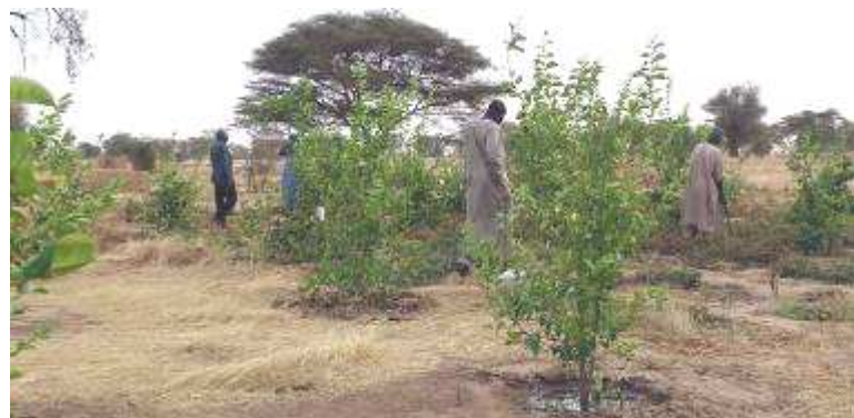
et en 2018 : plus de 2 m de hauteur