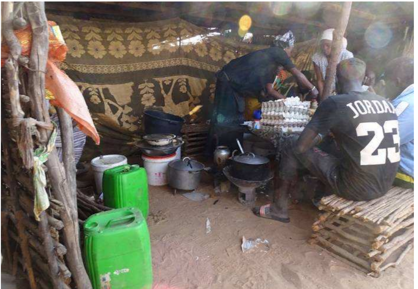
Les marmites en fonte d'aluminium sont souvent des culasses de moteur fondues. Les œufs sont amplement consommés