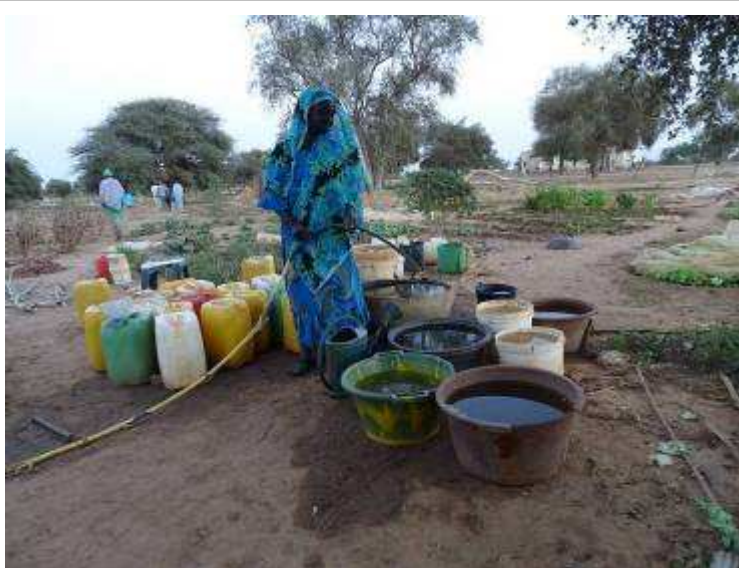
Les femmes auraient vraiment besoin d'un bassin d'arrosage pour stocker l'eau utilisée le soir