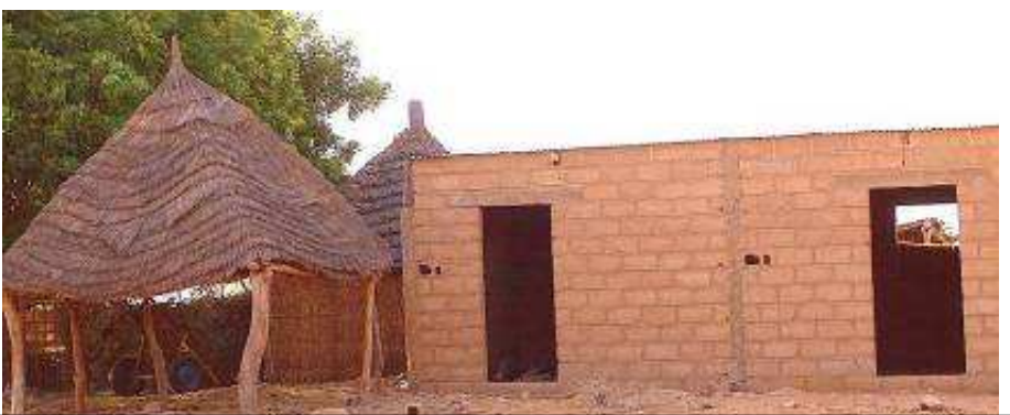
Lahat a acquis la 1ère voiture du village (et la 1er panne). Toutefois, il construit aussi sa maison en dur. Bravo ! !