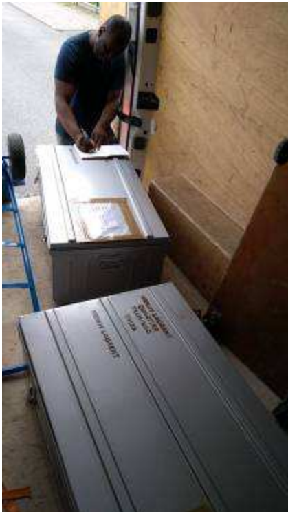
Les malles d'informatique pour le cybercafé de DIRFEL