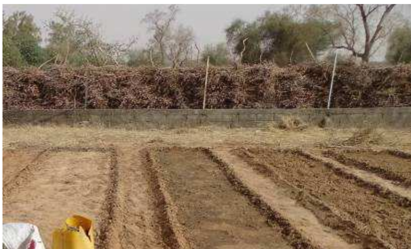
Le jardin inondé + la clôture "grillage - béton " défectueuse doublée par une clôture en poteau bois + branches tressées