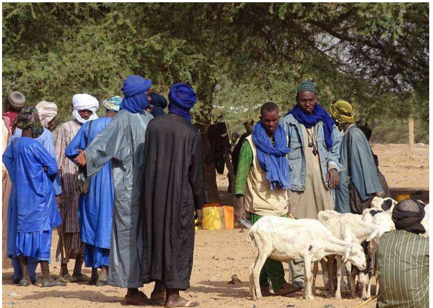
Les moutons n'ont pas de laine: ils se sont adaptés au climat !