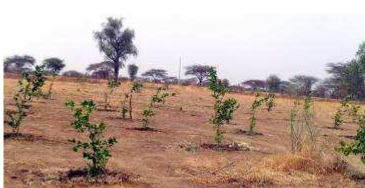
Les citronniers d'Afé plantés en 2017