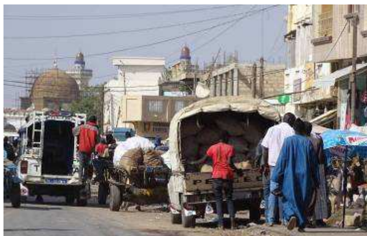
Embouteillage à l'entrée de la ville sainte de Touba, dans +/- la région de Linguère